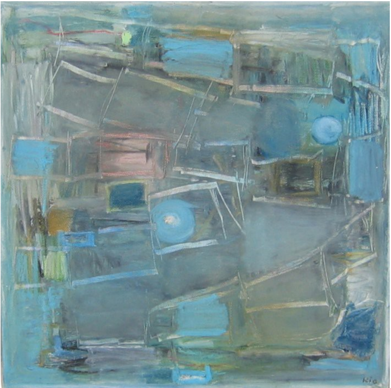
Tilhører min søster. Umiddelbart får man fornemmelsen af gråt i gråt. Jeg har ikke kunnet styre oliekriddene mesterligt. Gør det noget? Oliekriddt på lærred, måler 28x28 cm, 2007.