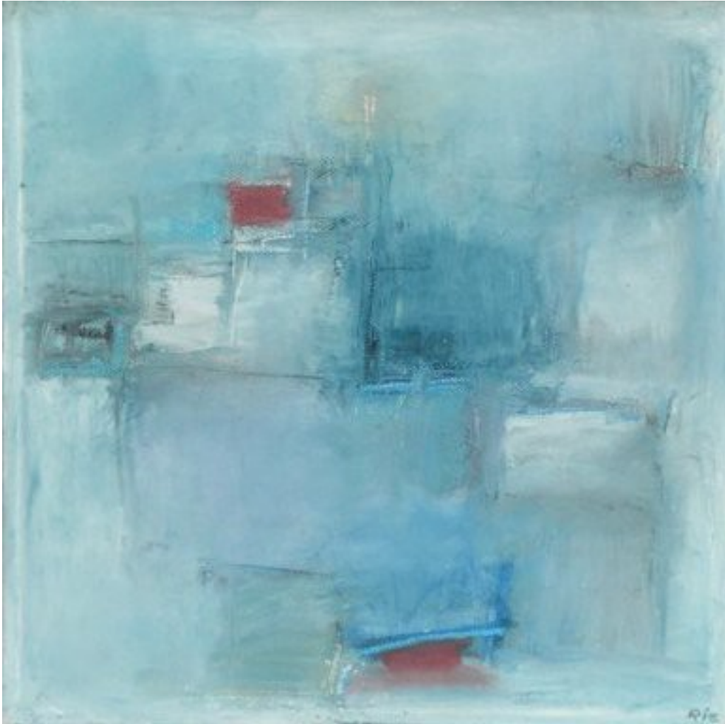
På landet 2007, oliekriddt på lærred, måler 25x25 cm

Med fedtede oliekriddt gnider jeg mig frem gennem lærredet. Jeg kan tydeligt mærke, at der er mere kraft og mæthed i olien end i akrylen. Man kan opnå større kontraster. Den turkise streg næsten lyser. Og der sænker sig en mildhed over billedet.