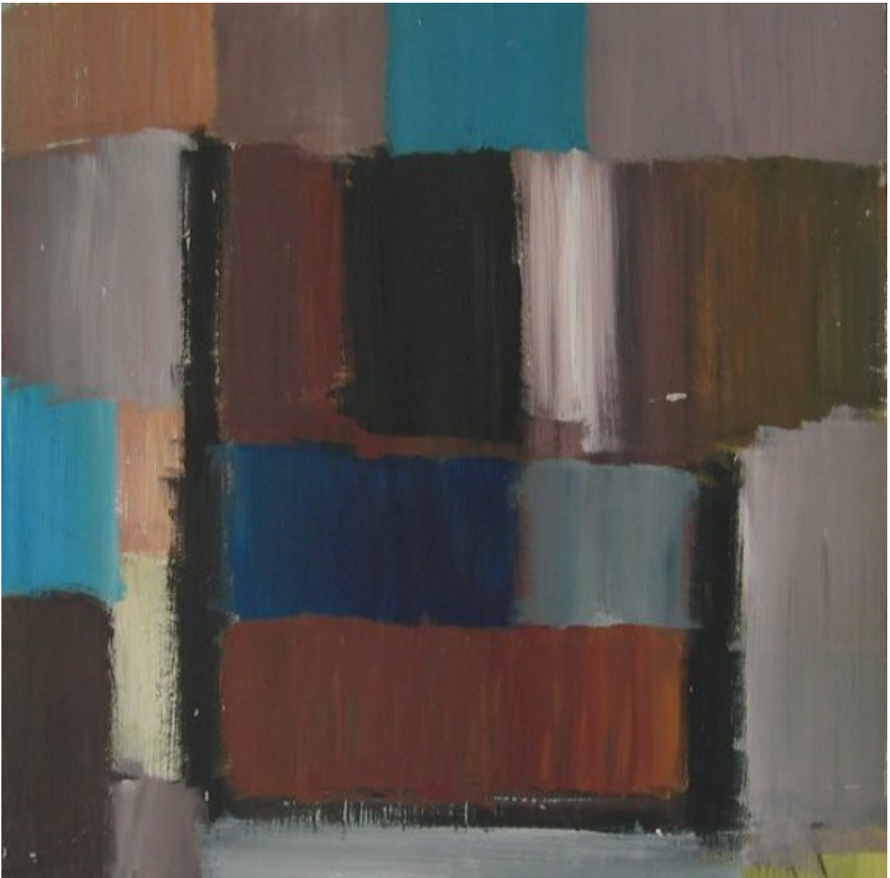
Gallo Skolen 1995, akryl på masonit, måler 46x46 cm

Jeg maler videre i Aarhus på en kunstscole for psykisk sårbare. Typisk firkantede felter op imod hinanden, uden jeg ved hvorfor. Farven interesserer mig (selvfølgelig) også.