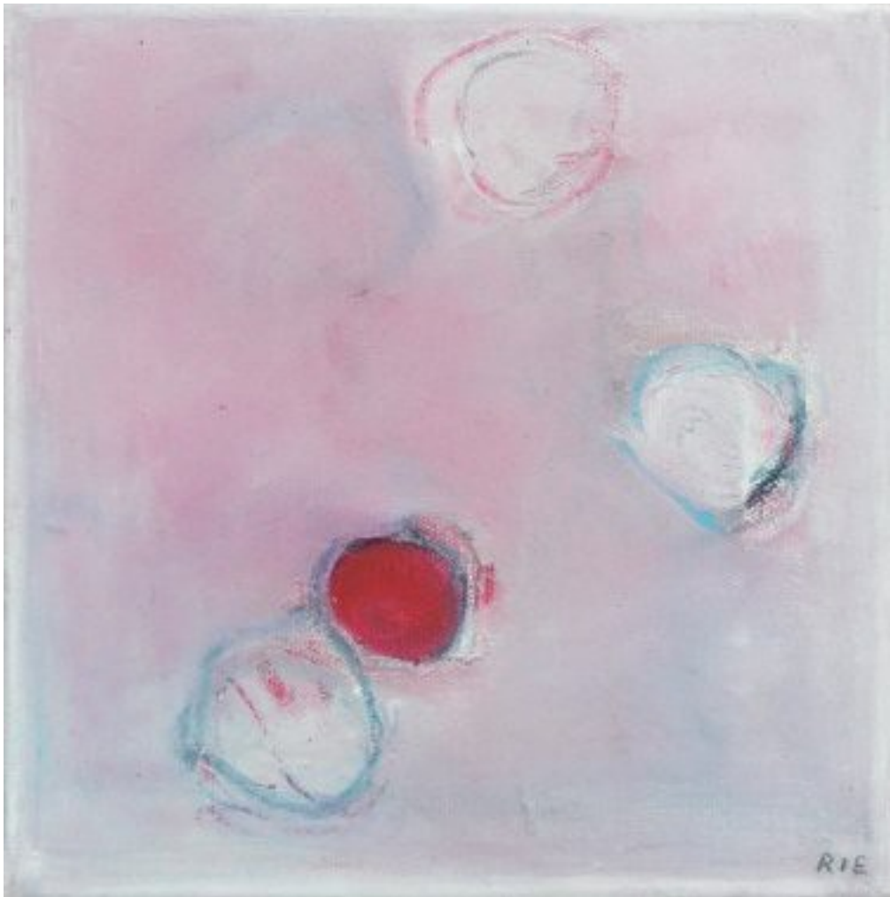
Oliekridt på lærred. På landet 2007, måler 20x20 cm. Malet i min tidligere kærestes hus på landet. Hvordan placerer man formerne (her runde) i forhold til hinanden for at opnå størst spænding?