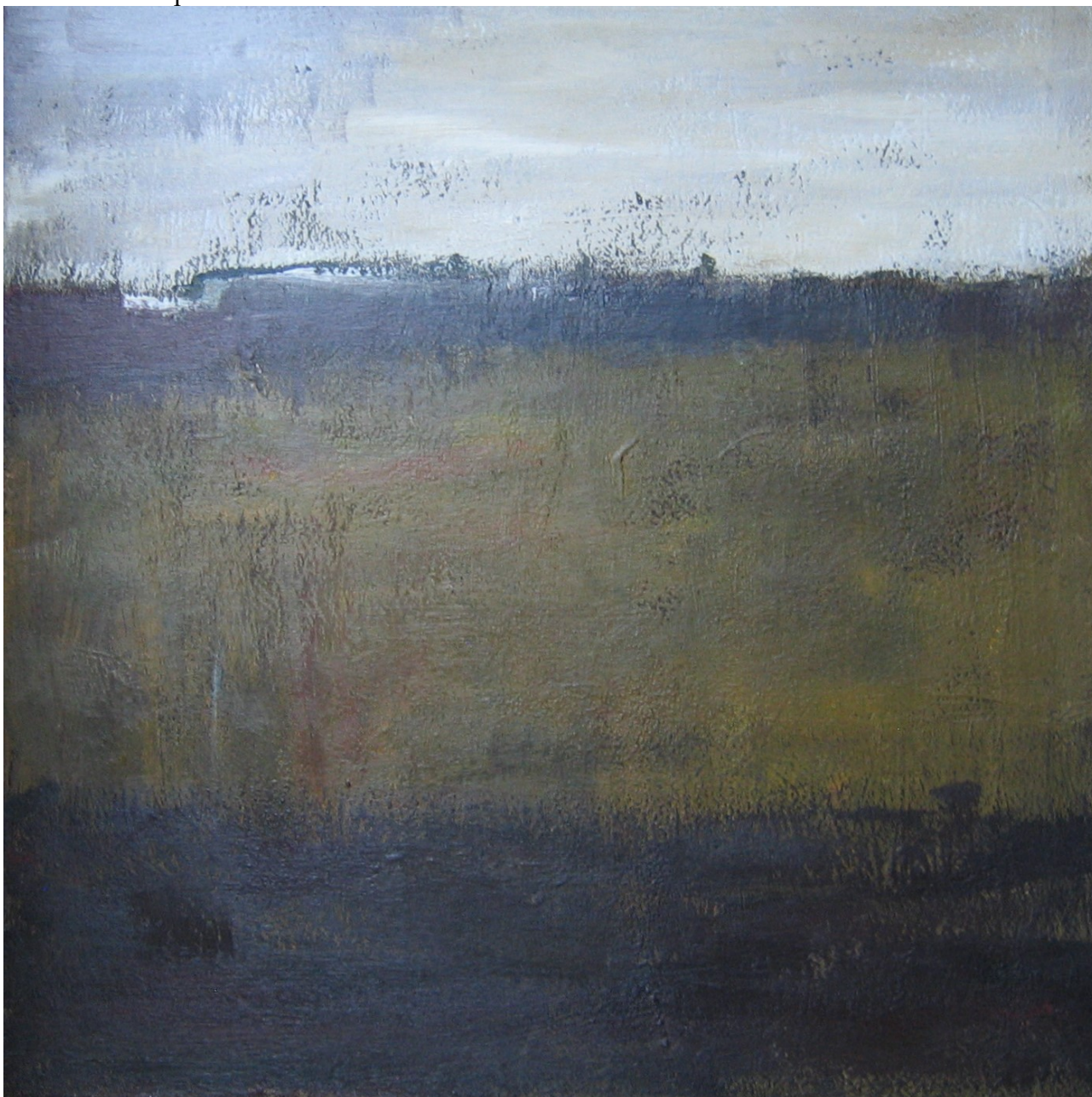
Akryl på lærred, måler 92x92 cm

I 2015 siger jeg mit kontorjob op og indleder en periode, hvor jeg maler på værestedet "Kragelund kultur og kontaktsted". Jeg står i kælderen (dog med godt lys) i mit eget selskab og skal bevare høj moral, og det kommer der en række billeder ud af. Jeg indkøber den dyre og ekstra gode maling. Her skal I se et par værker fra den tid.