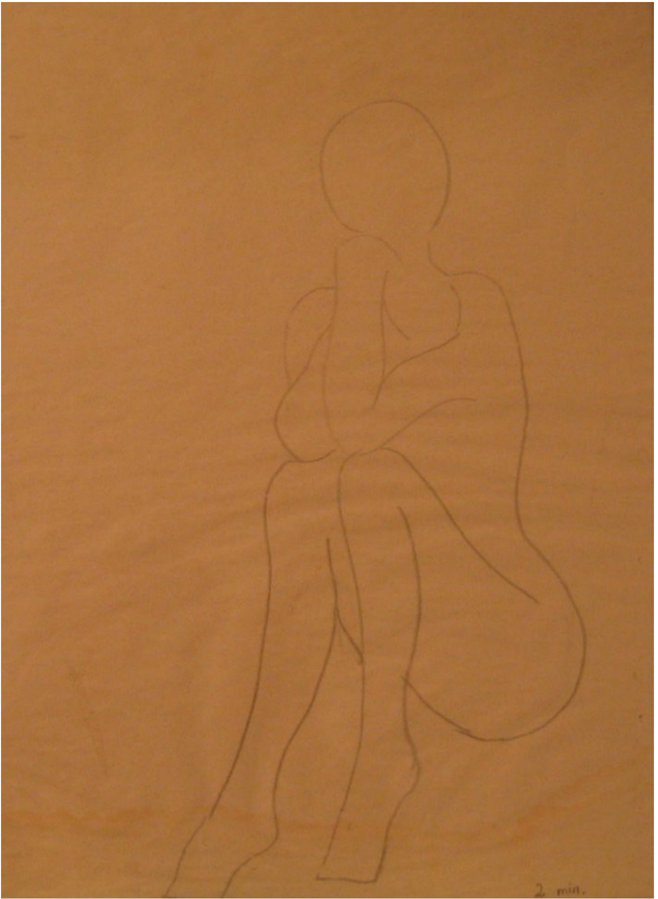
Croquis tegning fra akademitiden