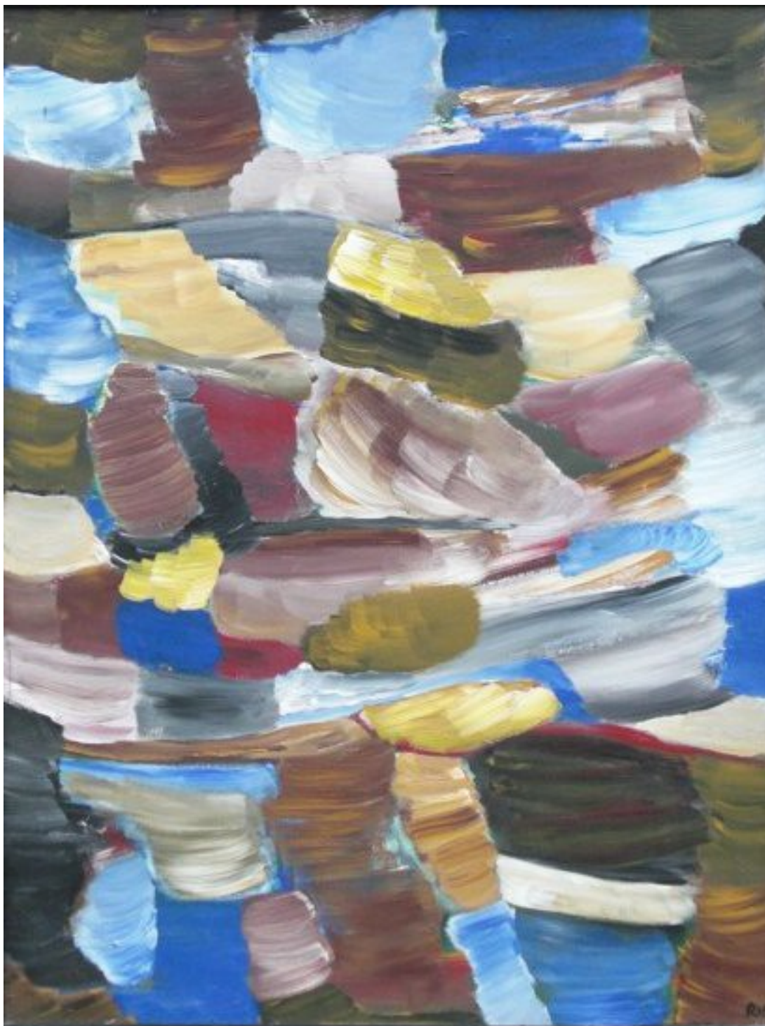
Haderslev 1993 Altets kræfter, akryl på masonit, måler 61x81 cm

Himmel og hav/landskab. En horisontlinje, der er der og dog ikke. Strøgene får land og himmel til at smelte sammen i eet virvar. Kompositionen er stram. Farverne en anelse skingre (kan have malet billedet i kunstigt lys en aften). Form og opløsning af form stemmer fint overens. Et godt match af løst og fast kendetegner billedet.