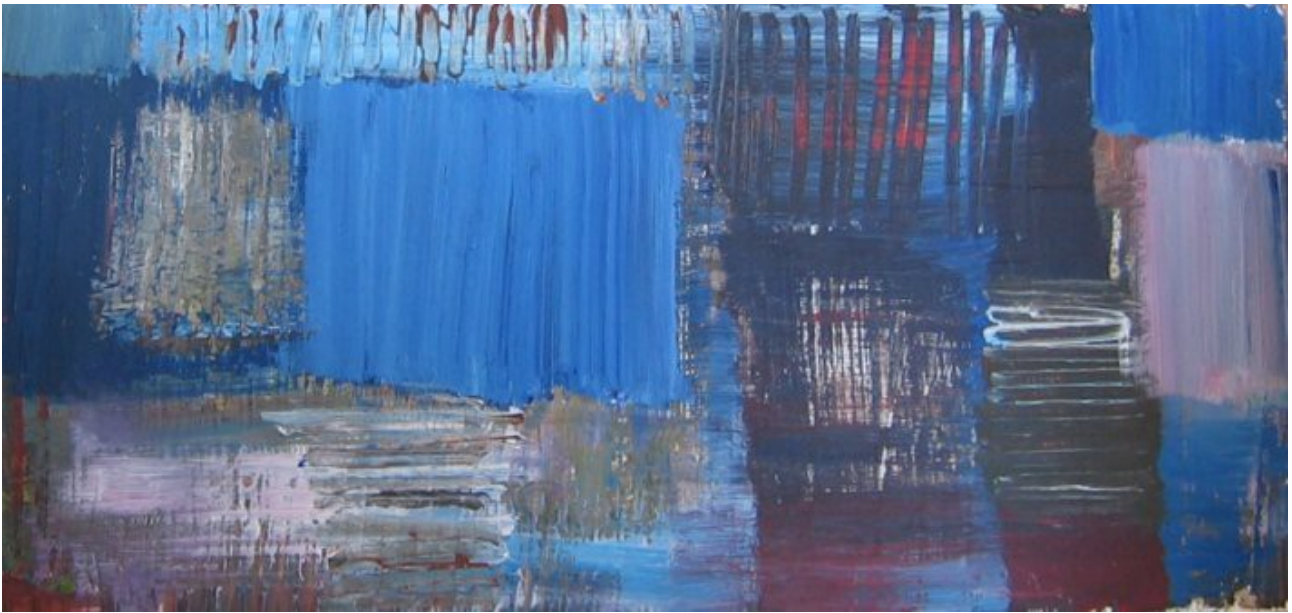
Marts 1996, akryl på masonit, måler 44x21 cm Bruger en teknik, hvor man ligesom skraber sig igennem til farven, der ligger indenunder.