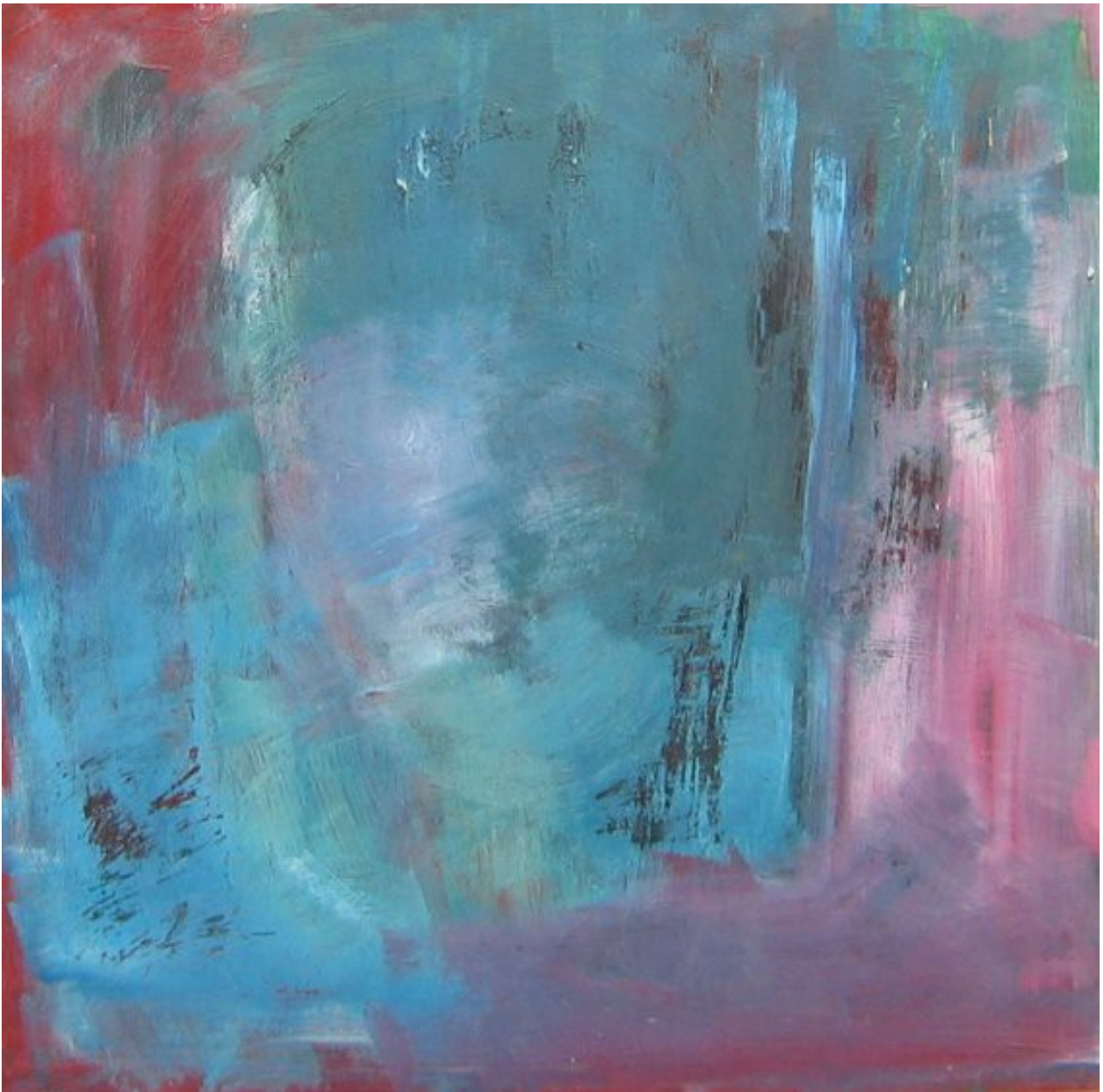
På Fristedet 2000, akryl på masonit, måler 63x61 cm. Efter en indlæggelse benytter jeg mig af