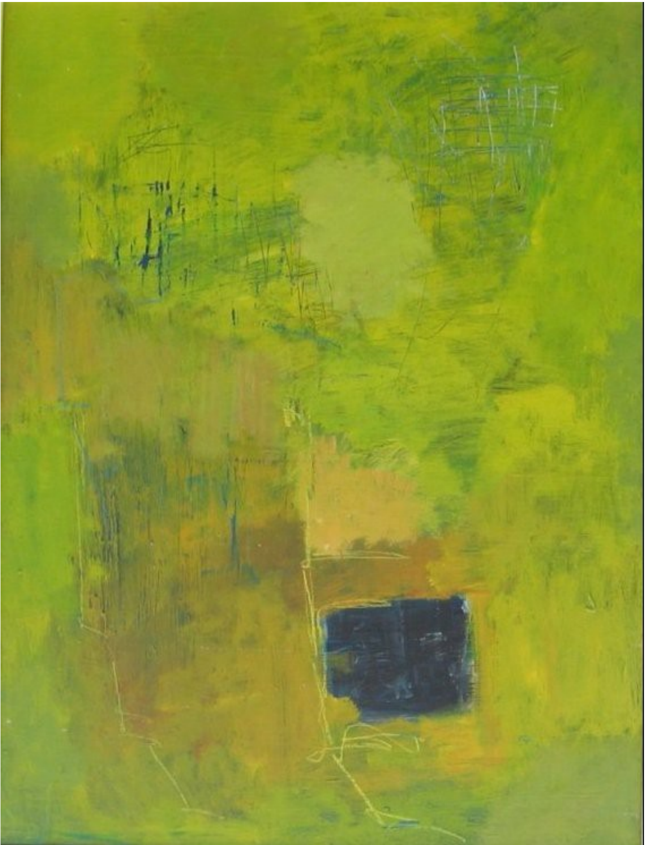
Der er blåt underneden, og jeg ridser det blå frem gemt bag en grøn/gullig nuance. Et gult kridt går gennem billedet, et enkelt mørkt felt. Akryl og pen på masonit, måler 61x81 cm. Billedet er fra akademiet 2000.