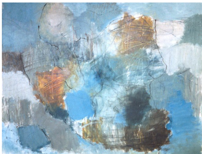
Kunstakademiet i en opblomstringstid (beskrevet senere). Akryl og pen på masonit, måler 61x81 cm. Et er gået til Gallo-foretagendets årlige auktion, et hænger hos min søster, et hos mine forældre, det sidste på en afdeling på psykiatrisk hospital, Risskov. Det første ejer jeg stadig selv.