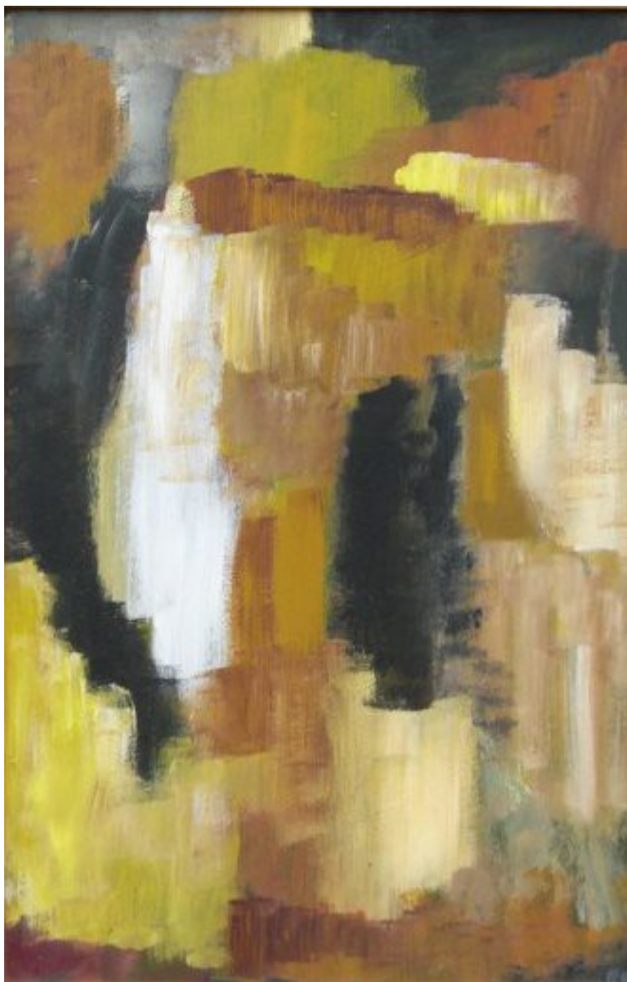
Juni- Haderslev 1993, akryl på masonit, måler 44x88 cm

Jeg husker, at maleriet er udstillet på en lægegang på hospitalet i Haderslev, og en læge siger til mig på gangen, at det er virkeligt godt!