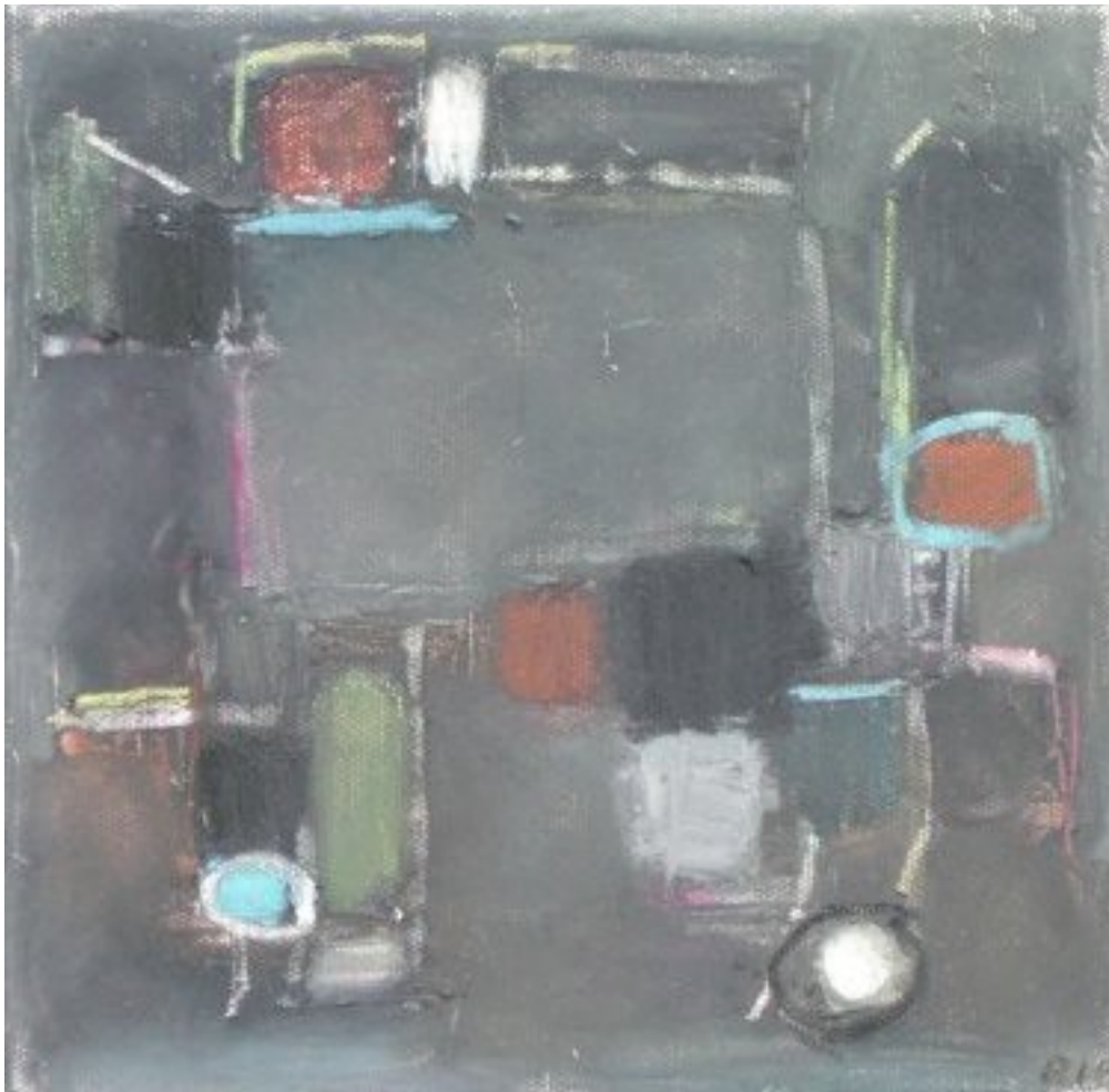
På landet 2007, oliekriddt på lærred, måler 20x20 cm. Hvordan skaber man lys i et ellers mørkt billede?