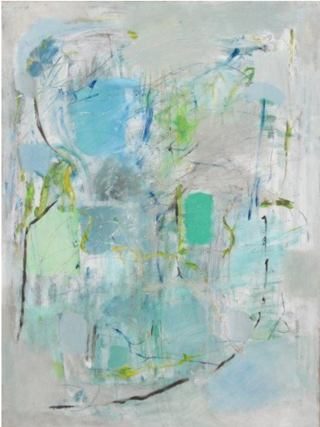
Kunstakademiet 1999, akryl på masonit, måler 61x81 cm

Et maleri fra den periode, hvor vi på uddannelsen har en vikarlærer. Han er specialist i akrylmaleri. I de måneder, han underviser os, blomstrer jeg op og får anerkendende ros for mine billeder. Også hvor billedet blot blev til som eksperiment eller på baggrund af en fastlagt opgave. Til sommerafslutningen det år fylder mine billeder lige så meget som de andres. Året før var de klemte op i et hjørne sammen med min ringe grad af selvtillid. Nu tør jeg vise mig frem.